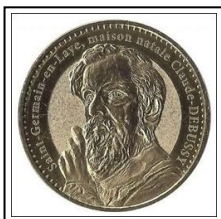
Monnaie de Paris :

Claude Debussy est né le 22 août 1862, à St Germain-en-laye. Dans cette longère du XIX siècle, posée au milieu de la campagne, le compositeur vient retrouver son épouse née en bourgogne. De 1901 au 28 juillet 1904, ils feront le voyage ensemble. Il dira que lors de ses séjours icaunais, il a goûté au calme et à la nature. « J'ai fait tout l'été, un retour à la terre, à la nature élémentaire et au braves gens » écrit t'il aux journalistes. Il composera : 'Le prélude, le vent dans la plaine extrait du livre des préludes de Debussy' » son chef-d'œuvre La Mer, contient notamment un extrait symphonique baptisé 'dialogue du vent et de la mer' . Après bien d'autres compositions le compositeur Français meurt le 25 mars 1918 à Paris.